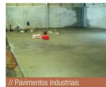
// Pavimentos Industriais