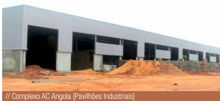
// Complexo AC Angola [Pavilhões Industriais]