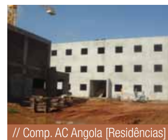
// Comp. AC Angola [Residências]