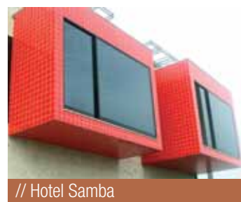
// Hotel Samba