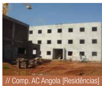
// Comp. AC Angola [Residências]