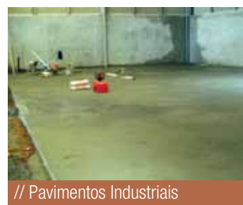
// Pavimentos Industriais