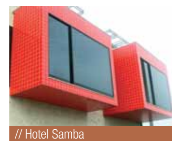
// Hotel Samba