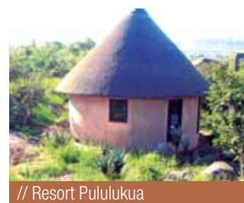
// Resort Pulumukua