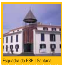
Esquadra da PSP | Santana