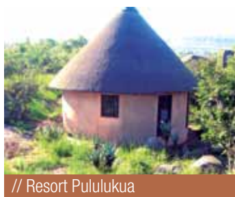
// Resort Pululukua