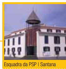
Esquadra da PSP | Santana