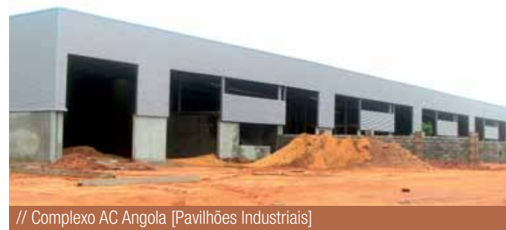
// Complexo AC Angola [Pavilhões Industriais]